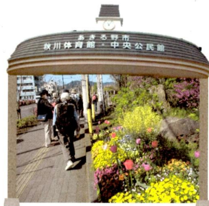
令和5年度 春の市内探訪の様子 「春の花と石造物めぐり」でかけよう! 五日市春の散歩道」