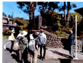
令和5年度市民企画講座「親子で学ぼう あきる野の歴史」

※詳細は市民企画講座募集案内をご覧ください。募集案内と申請書は、中央公民館で配布します。市HPからもダウンロードできます。