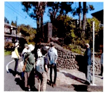
令和5年度市民企画講座「親子で学ぼう あきる野の歴史」表示の凡例

定…おおむね7講座(企画提案数は1団体・1市民2つまで) 対…市内の団体・サークル及び市民の方 用…5/13日(月)までに、所定の申請書を提出してください。 ※詳細は市民企画講座募集案内をご覧ください。募集案内と申請書は、中央公民館で配布します。市HPからもダウンロードできます。