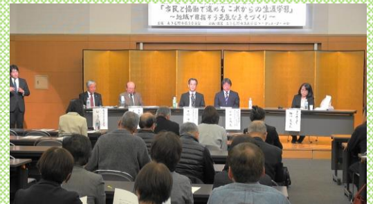
「平成30年3月 生涯学習シンポジウム」