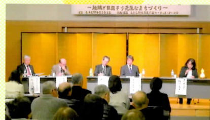
「平成30年3月 生涯学習シンポジウム」